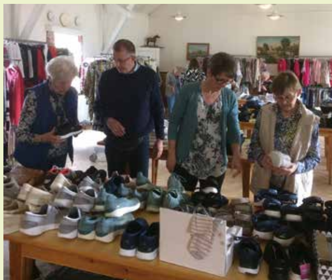
Der blev kigget, følt og handlet tøj og sko til Seniorshoppens tøjparty.