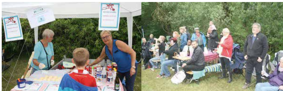
Billeder fra Sct. Hans Aften 2016 og 2017.

Kl. ca. 18:00 er bålet klart til gratis snobrød