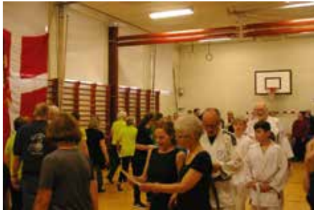
Indmarch med fane og sang