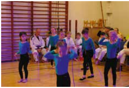
Prinsesserne, store og små lavede en flot opvisning