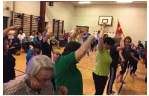
Fælles linedance var et festligt indslag