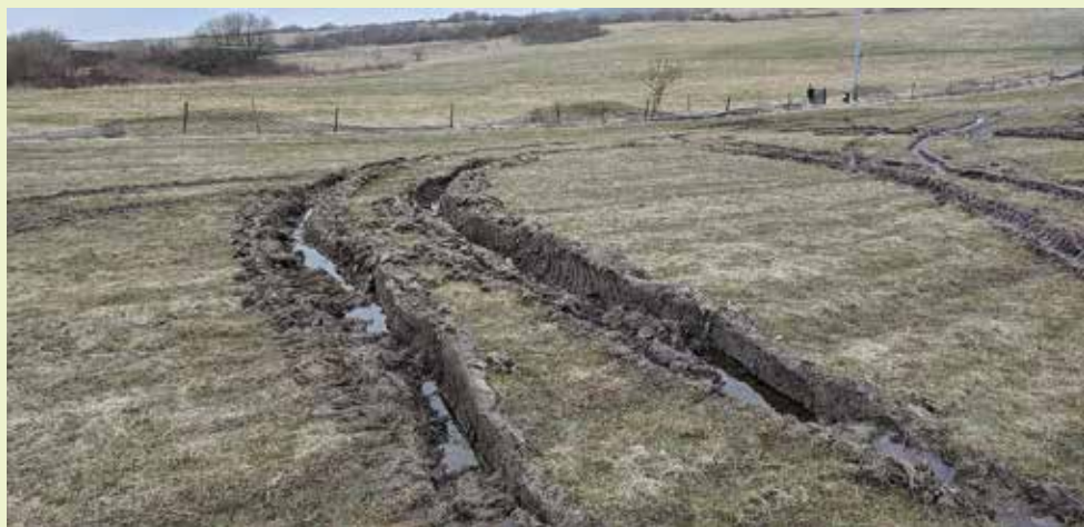
Der er lavet dybe hjulspor på et stort område af skibakken

I de landsdækkende nyhedsmedier diskuteres det heftigt, om vi vil have ulve i Danmark eller ej. Sådan nogle kan vi ikke just prale med at have gående i Rørslev og Stærkende. Men vi har såmænd også nok at gøre med dens lille røde fætter, som gerne går på besøg hos folk med høns og lignende.