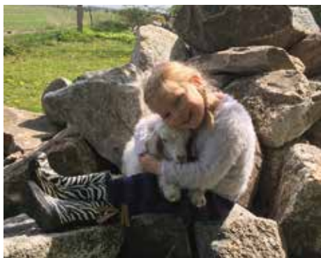
Her er Augusta med vores lille bukkekid Søgaardens Samiko, som nu er blevet 1 år og skal med på Roskilde Dyrskue d. 8.- 10. juni 2018.