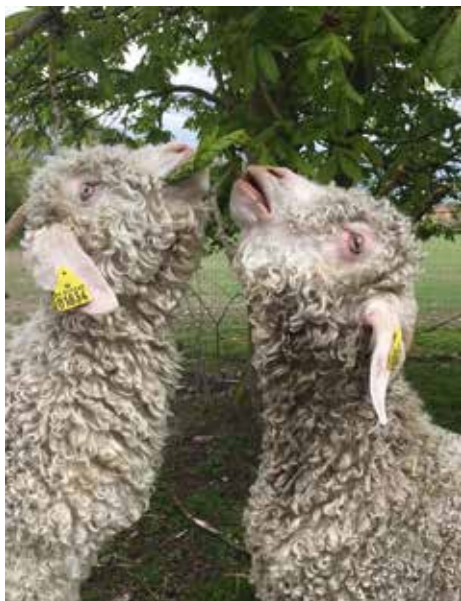
To sultne geder

Gederne elsker grene med blade så skal du i gang med at beskære buske og træer, eller klippe bøgehækken er vi meget interesseret i FRISK afklip. Geder må få birke-, æble-, pære- og bøgegrene, nøddebuske, brombær- og hindbærgrene samt grangrene. Stedsegrønt, liguster og efeu kan de ikke tåle.